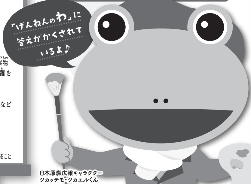
日本原燃広報キャラクター ツカッテモ・ツカエルくん